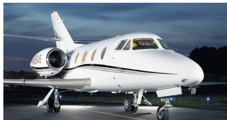
Le jet privé Falcon 100 vendu par Dassault.