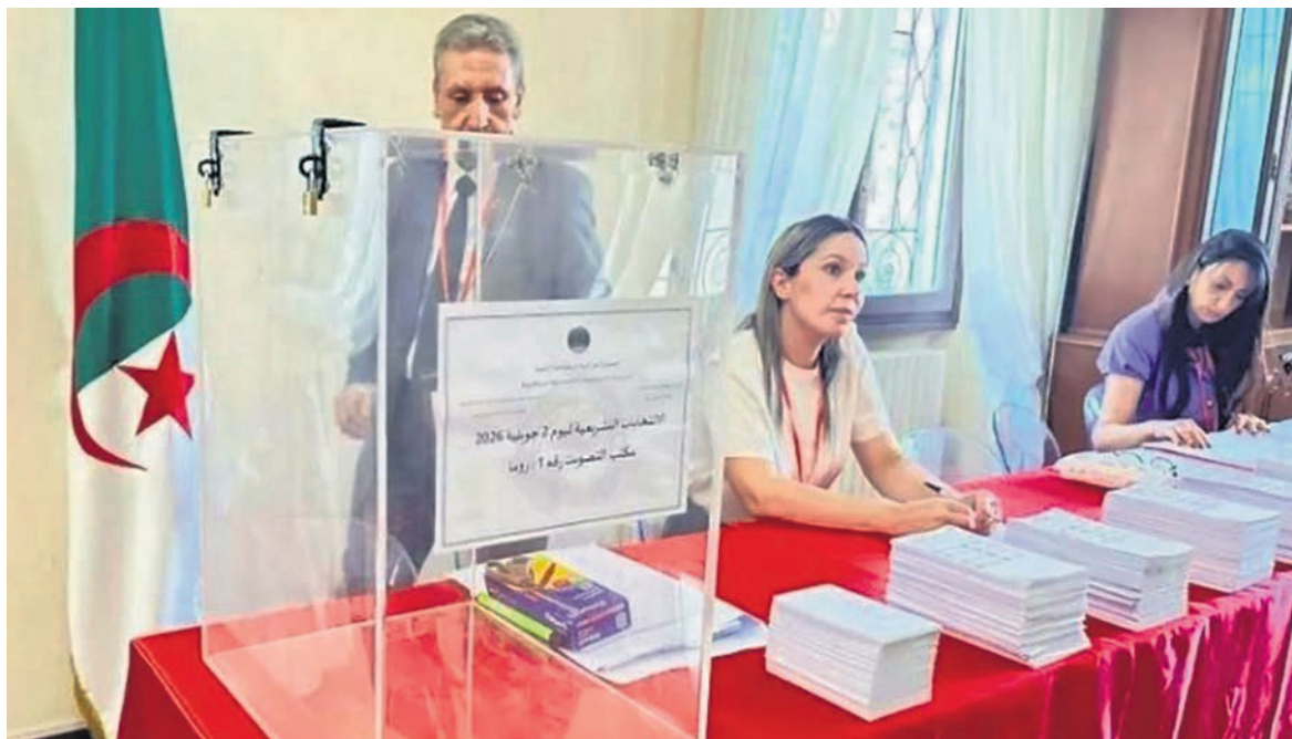
Lors du vote organisé dans la diaspora algérienne.