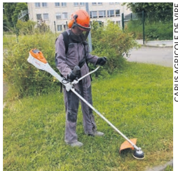
CAPUS AGRICOLE DE VIRE

La plupart des responsables politiques qui ont proposé des mesures contre la canicule partageaient cette préoccupation. C'est