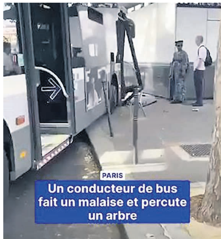
CAPTURE D'ÉCRAN TFI