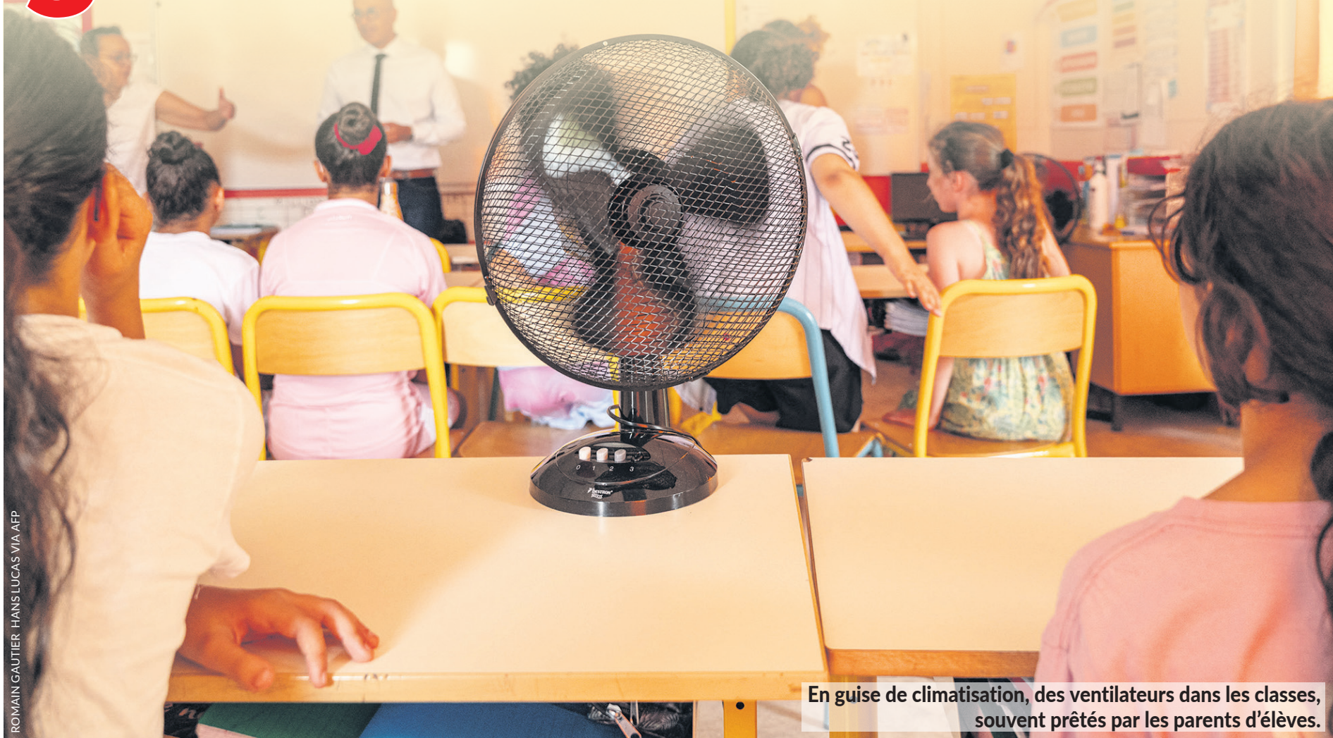
En guise de climatisation, des ventilateurs dans les classes, souvent prêtés par les parents d'élèves.