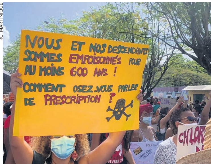
Manifestation contre le chlordécone en Martinique.

Le 22 juin, le verdict de non-lieu concernant l'empoisonnement des terres, des eaux et des populations de Guadeloupe et de Martinique par le chlordécone a été confirmé par la cour d'appel de Paris.