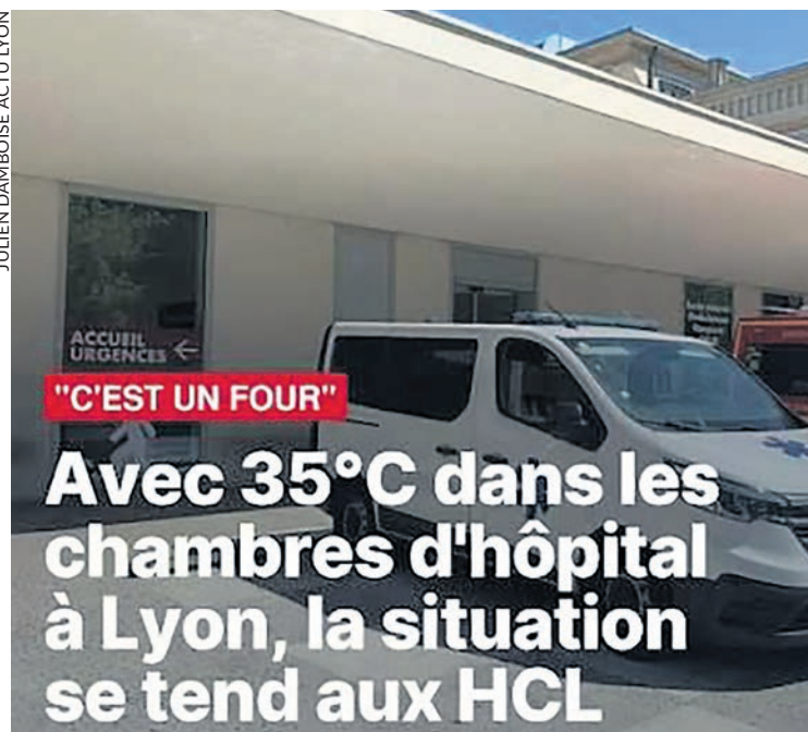
Entrée des Urgences de l'hôpital de La Croix-Rousse.