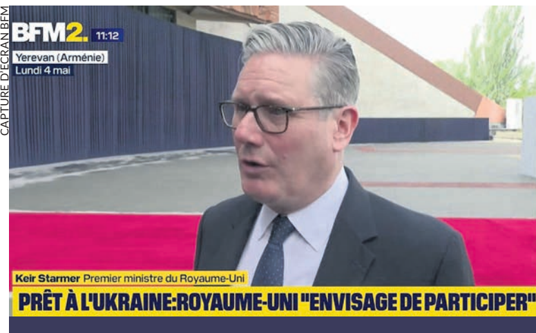
Starmer s'engageant à participer à la guerre en Ukraine.