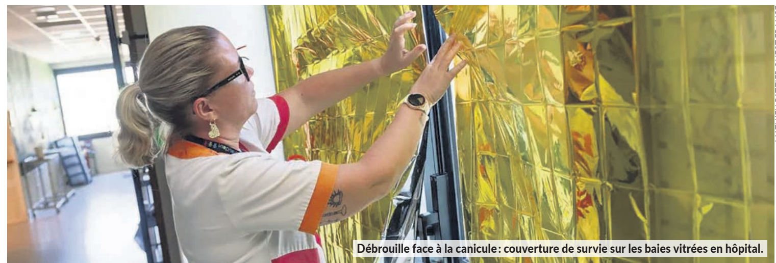
Débrouille face à la canicule : couverture de survie sur les baies vitrées en hôpital.