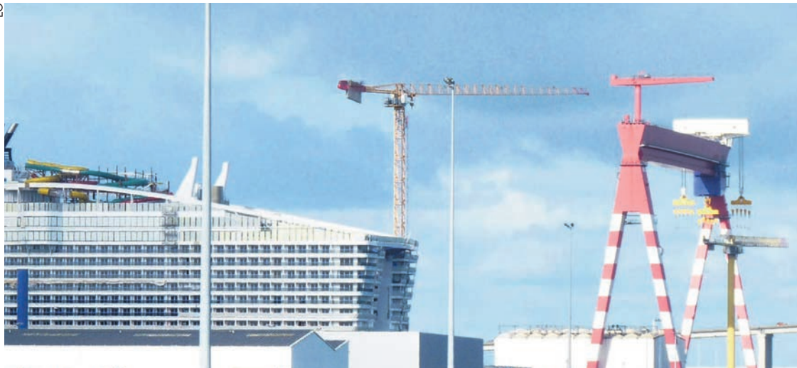
Paquebot en fin de construction aux Chantiers de l'Atlantique.