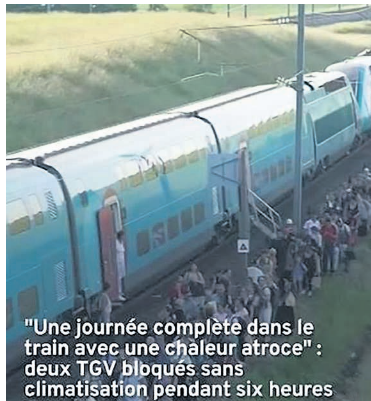
"Une journée complète dans le train avec une chaleur atroce" : deux TGV bloqués sans climatisation pendant six heures

Pour faire face, tout manque, et d'abord le matériel roulant adéquat. Sur des lignes TER ou Intercités