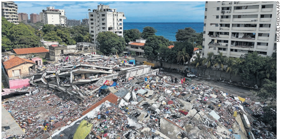
Vue aérienne de bâtiments effondrés à Caraballeda, dans l'État de La Guaira, le 30 juin.

Dans une telle tragédie, au Venezuela comme partout, les pauvres ne peuvent compter que sur leur solidarité. L'État montre son vrai visage : efficace pour le maintien de l'ordre et la répression mais incapable de se mettre au service de la population. Dans ces conditions, les puissances impérialistes peuvent se donner le beau rôle à peu de frais. L'armée américaine a déployé une centaine de Marines pour rouvrir le port de La Guaira endommagé et permettre le débarquement de l'aide humanitaire. Le gouvernement de Trump a débloqué une aide financière et des secouristes de divers pays se rendent sur les lieux de la catastrophe. Les États-Unis, qui contrôlent à nouveau le pays depuis l'enlèvement du président Maduro, profitent de