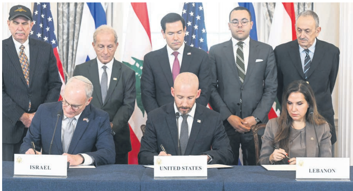
Les délégations israélienne et libanaise à Washington le 26 juin.

Ne cachant rien de ses intentions, le Premier ministre israélien Netanyahu