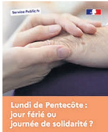
Lundi de Pentecôte : jour férié ou journée de solidarité ?

Après la canicule de l’été 2003, qui avait provoqué la mort de près de 15 000 personnes, Jacques Chirac, alors président, et son Premier ministre Jean-Pierre Raffarin avaient imposé à tous les salariés une journée de travail supplémentaire.