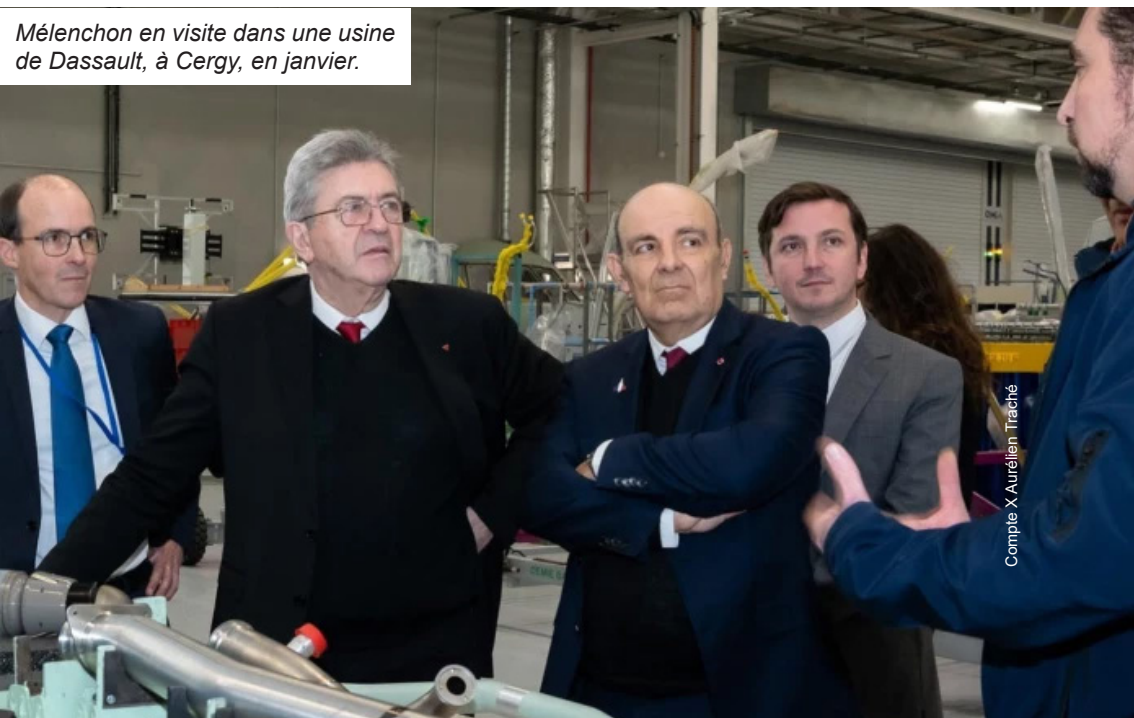
Mélenchon en visite dans une usine de Dassault, à Cergy, en janvier.

Chacun des candidats qui se bousculent pour prendre la suite de Macron à l'Élysée mènera, au pouvoir, la politique exigée par les grands patrons. Car tous respectent leur propriété privée, c'est-à-dire