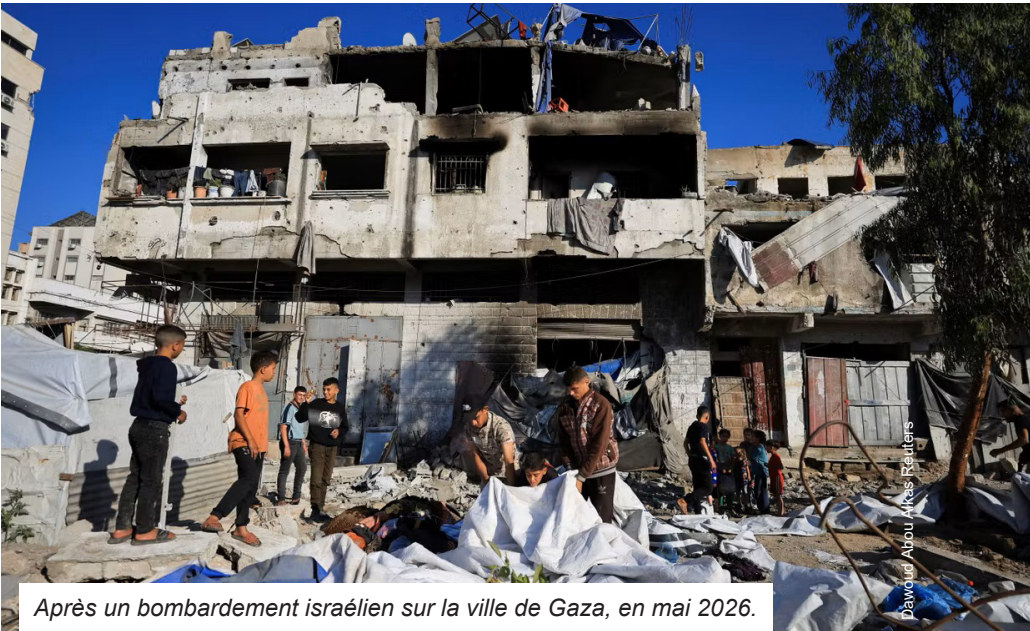
Après un bombardement israélien sur la ville de Gaza, en mai 2026.