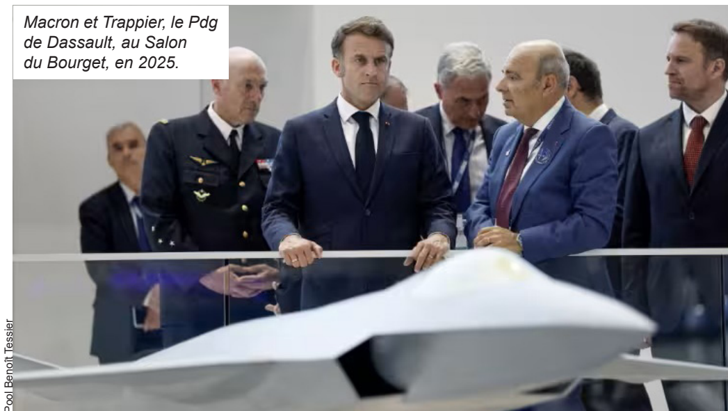
Macron et Trappier, le Pdg de Dassault, au Salon du Bourget, en 2025.

Quant aux entreprises de l'armement, les Dassault, Thales, Naval-Group, MBDA, elles voient les commandes affluer et le cours de leurs actions s'envoler. Chaque missile lancé au-dessus du golfe Persique, chaque Rafale qui vole dans le ciel de l'Ukraine vient remplir un peu plus leurs coffres-forts. Un seul missile coûte 3 ou 400 000 euros ; une heure de vol d'un Rafale, c'est 20 000 euros... En 2025, la fortune de la famille Dassault s'est élevée à près de 36 milliards d'euros, en progression de plus de 10 %.