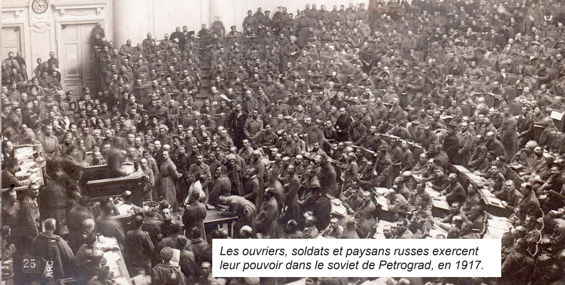
Les ouvriers, soldats et paysans russes exercent leur pouvoir dans le soviet de Petrograd, en 1917.

pour protéger ses intérêts fondamentaux.