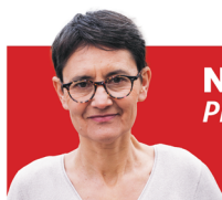
Nathalie Arthaud Présidentielle 2027