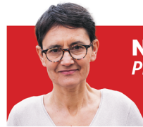
Nathalie Arthaud Présidentielle 2027

Travailleurs de tous les pays, unissons-nous !