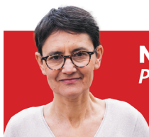
Nathalie Arthaud Présidentielle 2027

Les salaires et les retraites doivent suivre !