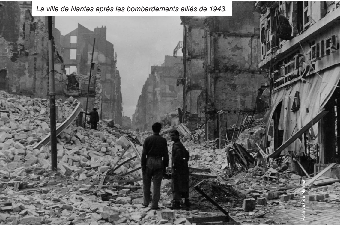
La ville de Nantes après les bombardements alliés de 1943.

La guerre économique à laquelle se livrent les grands groupes de toute la planète n'est pas la nôtre. Refusons d'en être la chair à profits !