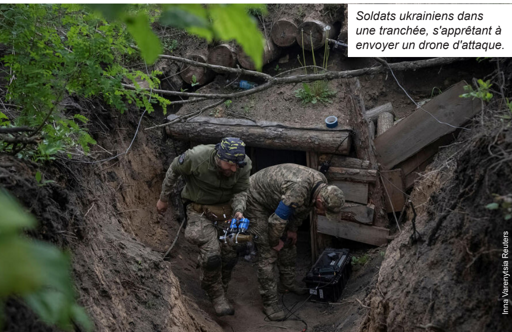
Soldats ukrainiens dans une tranchée, s'appêtant à envoyer un drone d'attaque.

Ce sont des guerres pour contrôler le pétrole, les terres rares, les matières premières ou des voies stratégiques comme le canal de Suez ou le détroit d'Ormuz. Car, derrière les belligérants directement impliqués, les puissances impérialistes sont toujours à la manœuvre.