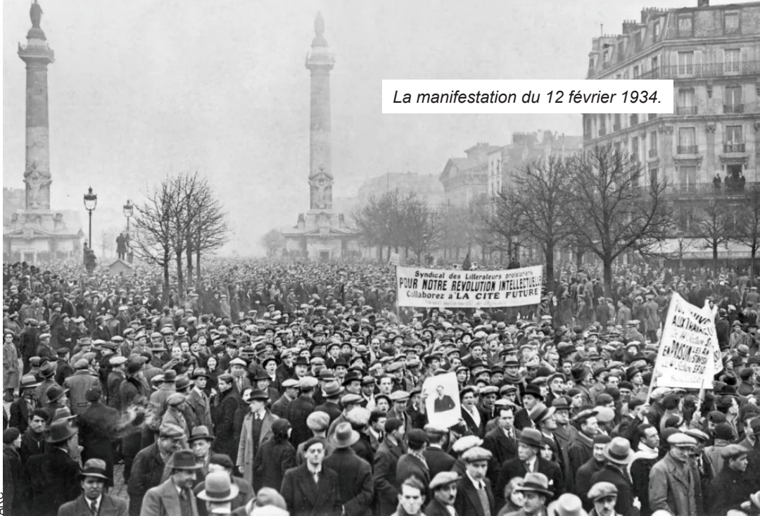
La manifestation du 12 février 1934.