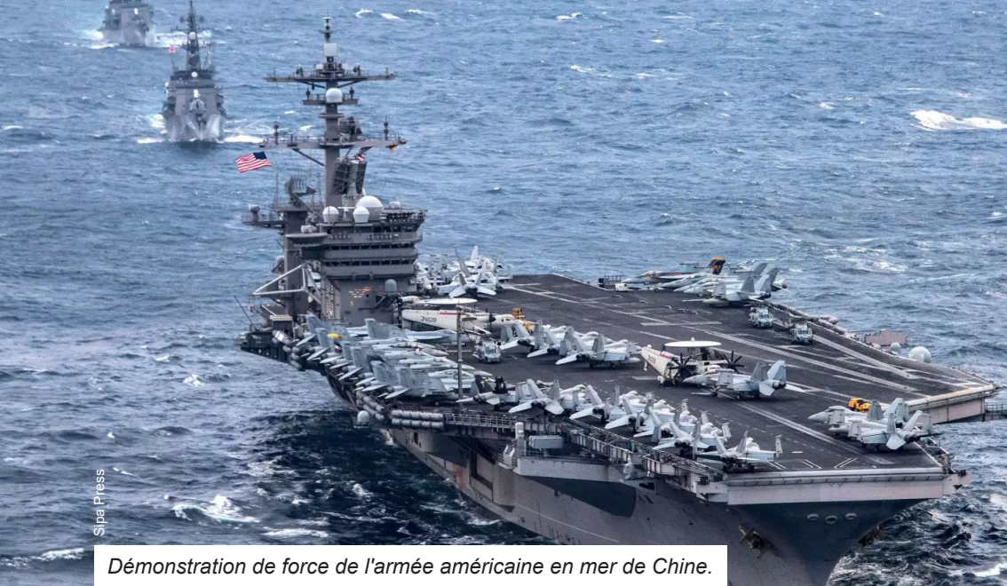
Démonstration de force de l'armée américaine en mer de Chine.

savoir qui, des capitalistes occidentaux ou des oligarques russes, profitera des minerais ou des terres agricoles fertiles de l'Ukraine.